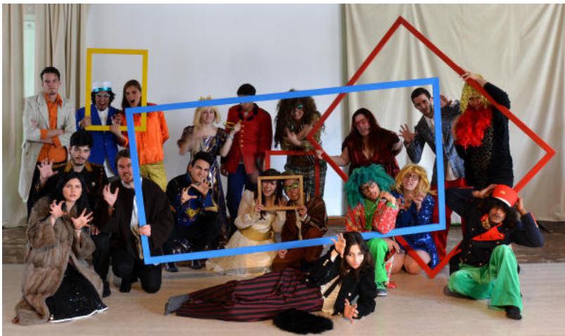
A Lausanne, Scenicprod a présenté en avril son 9e spectacle.

par Julien Culet - Dès octobre, un projet commun tentera de réintégrer les Genevois de 17-25 ans en difficulté. Une recette qui marche déjà à Lausanne.